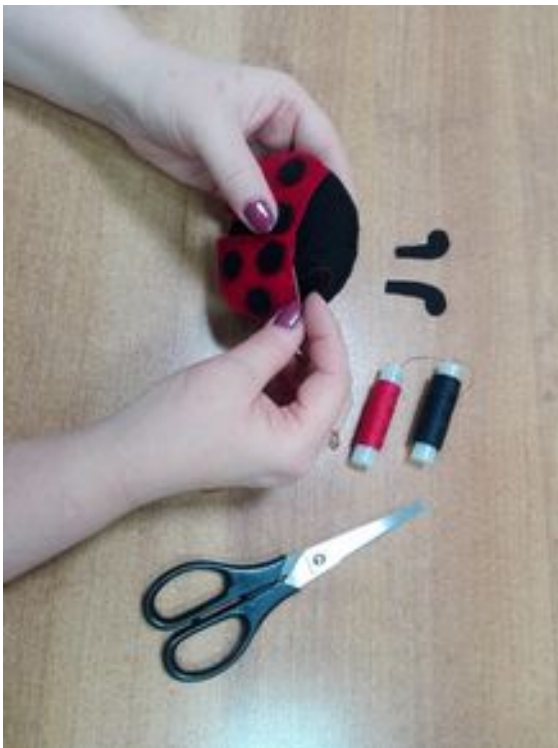
8. Оформление изделия.