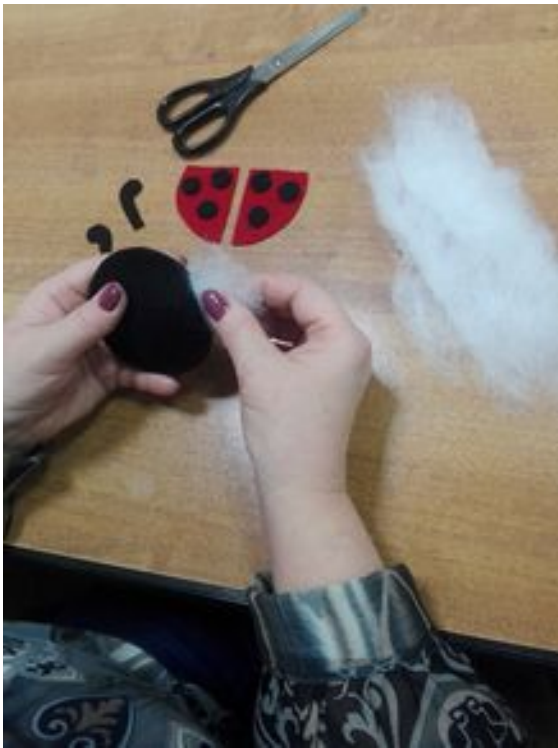
7. Сборка изделия.